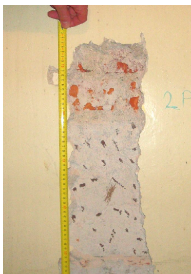
2. NP nadpraží 1 ODN