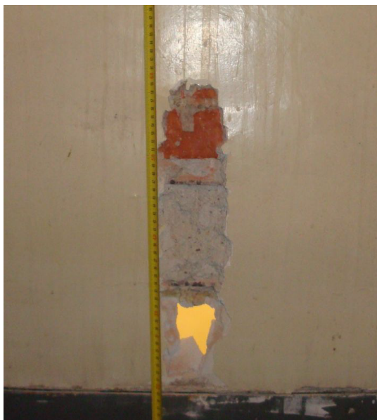
1. NP nadpraží odn