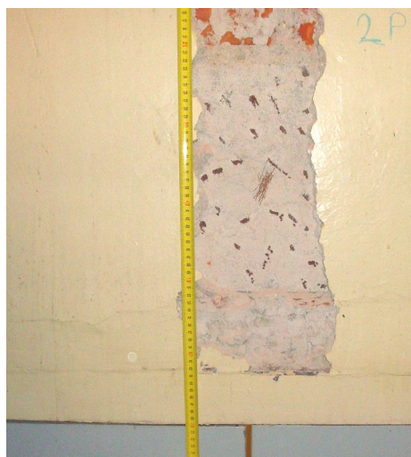
2. NP nadpraží 2 ODN