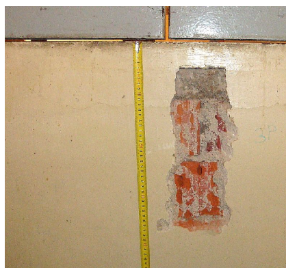
3. NP u podlahy ODN