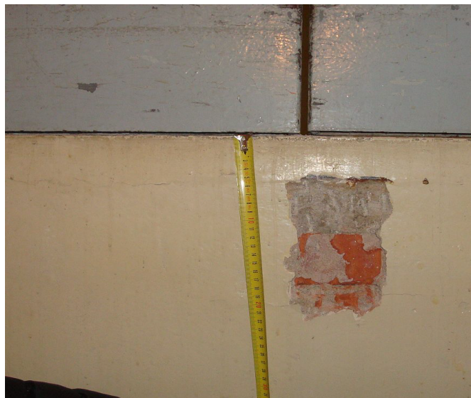
1. NP u podlahy odn