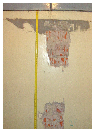
2. NP u podlahy ODN