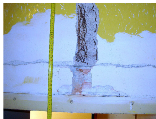
4. NP nadpraží 1 ODN